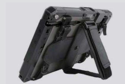
スタンドを立てたイメージ