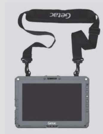
タブレットとの 装着イメージ