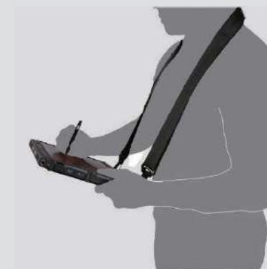
肩にかけて 使用するイメージ